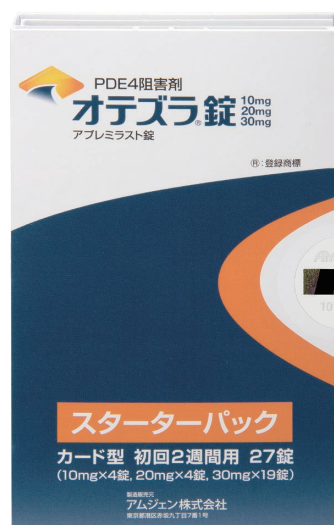
オテズラ錠のスターターパック

飲み始めの6日間は、飲み始めた頃に起きやすい 副作用の発現を防ぐために毎日10mgずつ お薬の量を増やし、6日目以降は30mgを 1日2回、朝と夕方に1錠ずつ服用します。